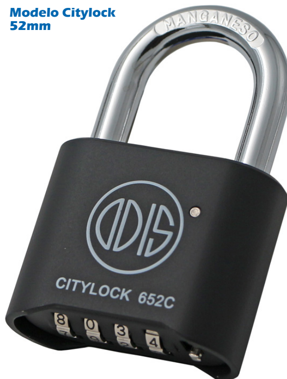
Modelo Citylock 52mm